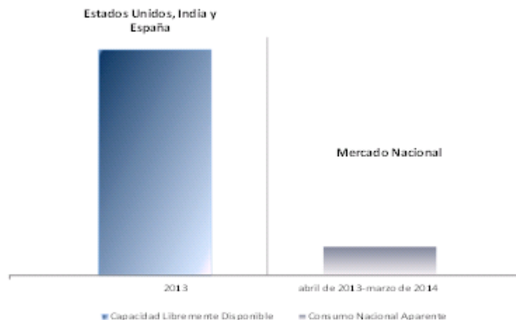
Gráfica 3. Mercado nacional vs capacidad libremente disponible de los Estados Unidos, España e India (Toneladas métricas)